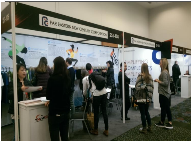
遠東新世紀展出情形