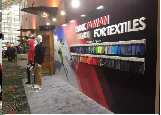
臺灣館形象區吸引買主駐足