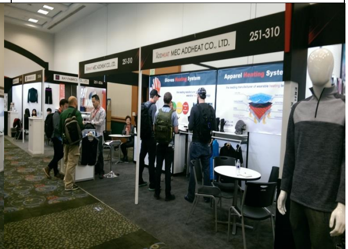
美上電熱展出情形