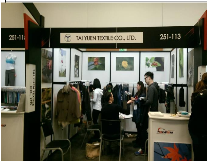
台元紡織展出情形