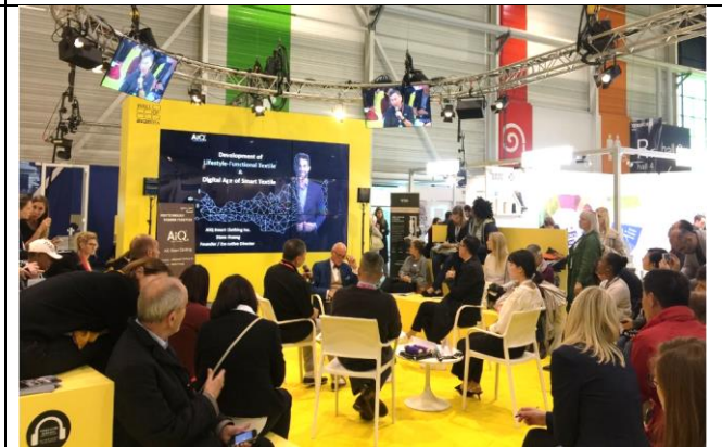
Avantex agora 論壇活動討論智慧衣趨勢