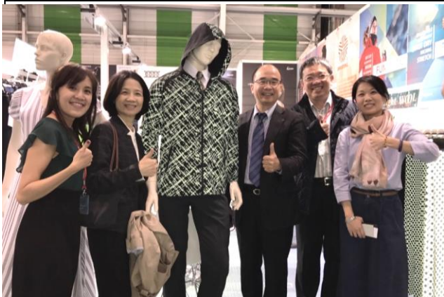
駐法代表處經濟組賴組長(右3)及台灣貿易中心蕭主任(左2)到場視察