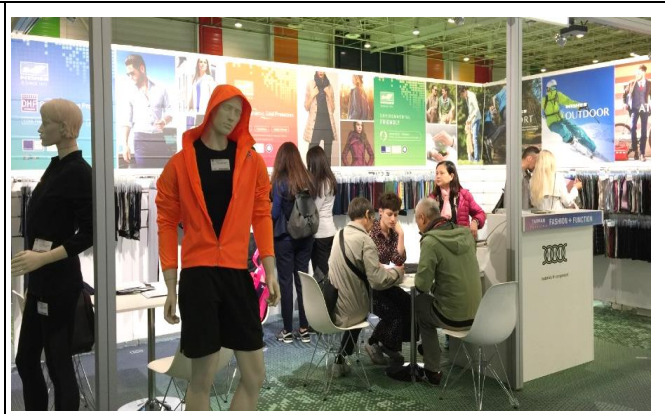
台灣展商偉全紡織接待買主情形