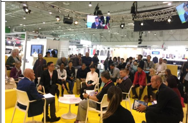
Avantex agora 論壇活動