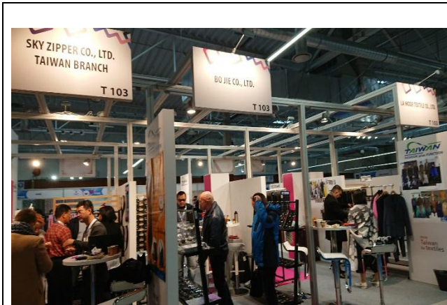
買主蒞臨台灣館聯合推廣攤位