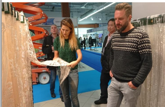
買主至詠鑫公司攤位洽談