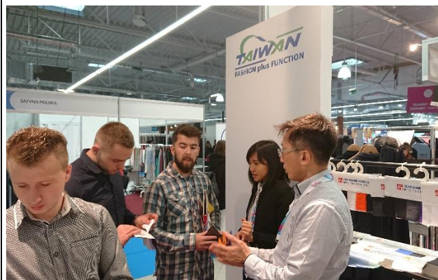
茂達興公司接待買主洽談情形