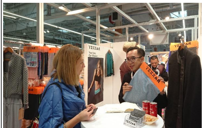
得溢公司接待買主洽談情形