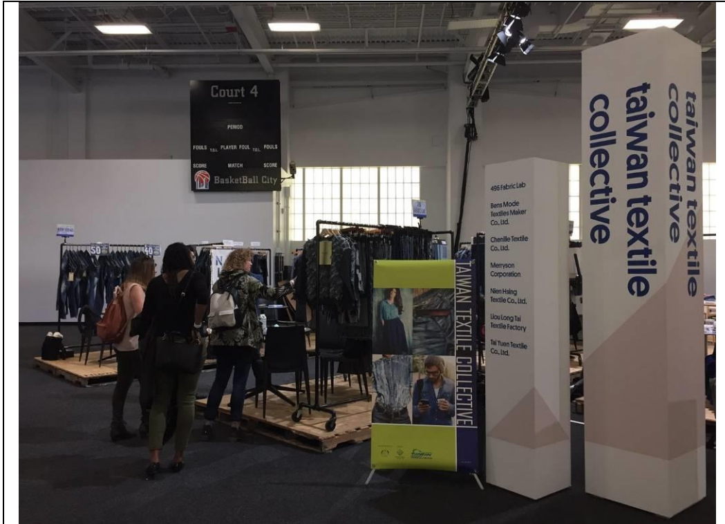
台灣環保紡織品聯合攤位展出情形