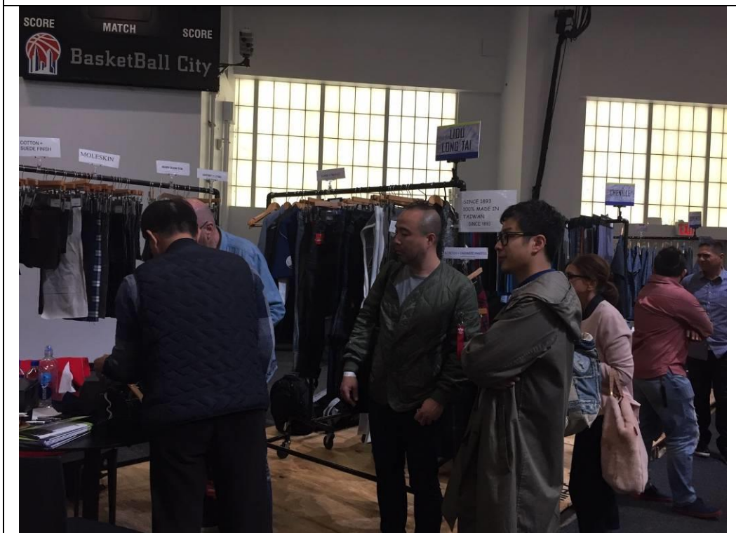
台灣環保紡織品聯合攤位展出情形