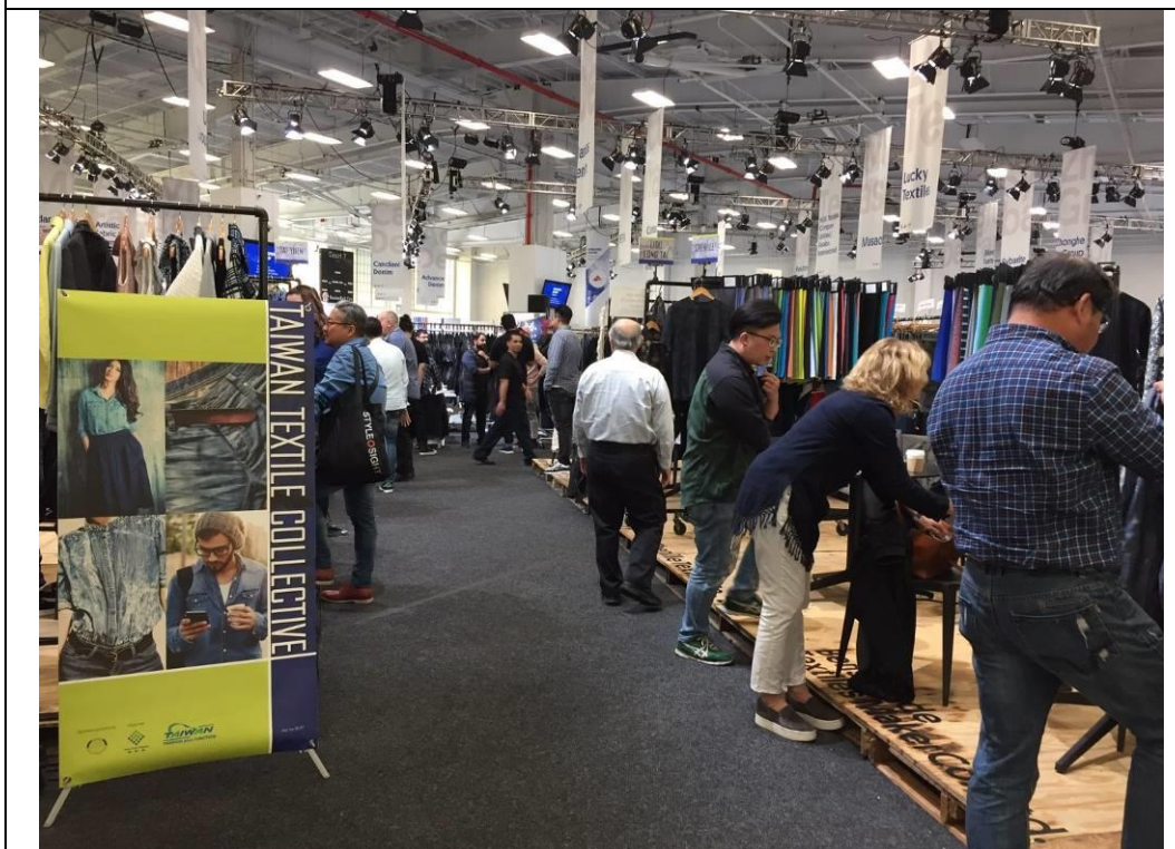
台灣環保紡織品聯合攤位展出情形