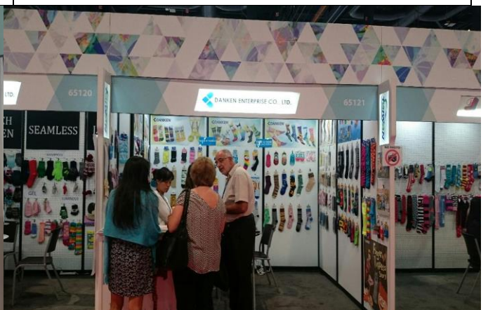
東肯企業接待買主洽談情形