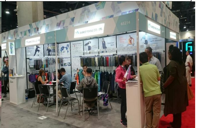
宏遠興業接待買主洽談情形