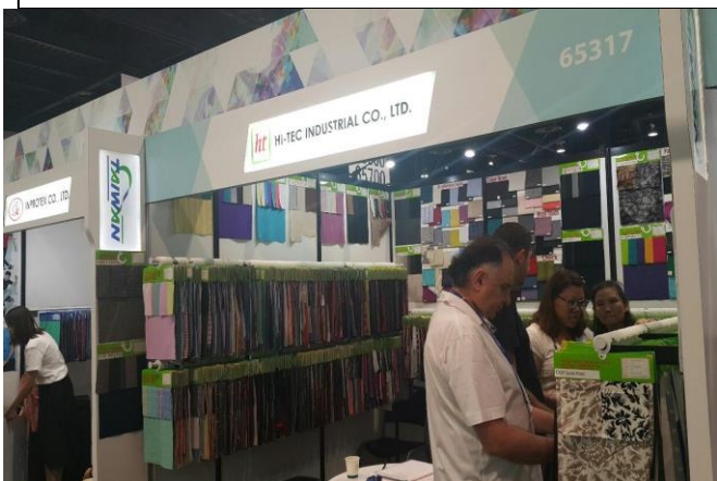
帛諦國際貿易接待買主洽談情形